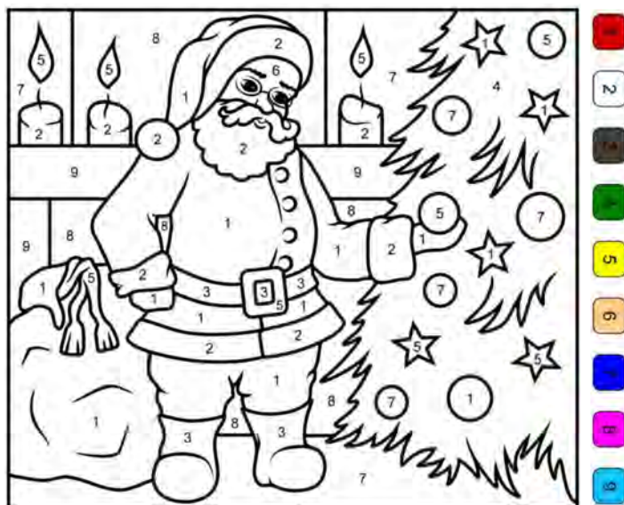
Ausblick Waldweihnachten / 17. Dezember 2021 / Autor: Joel Fischer