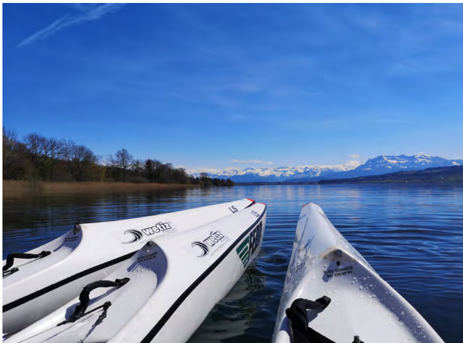
Openwater Training Sempachersee