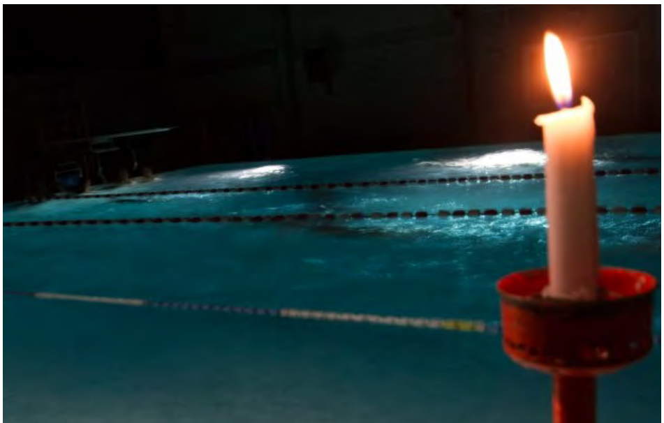
Schwimmen bei Kerzenlicht / 06. November 2021 / Autorin: Rebecca Küttel