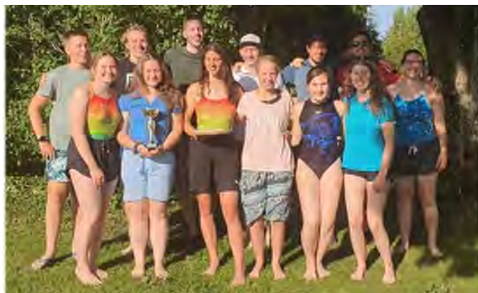
Wettkampf Grenchen / 26. Juni 2021 / Autorin: Svenja Zoller