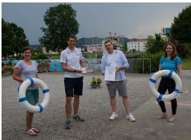
Zertifizierung IG Sport Luzern / 09. Juli 2021 / Autor: Pascal Muther